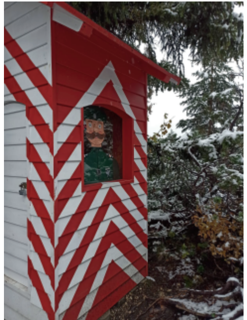
Zollhäuschen am Schmugglerpfad

Unsere letzte Tour führt uns auf den Iseler. Leider erwarten uns beim Ausstieg aus der Bergbahn Schneetreiben und dichter Nebel. Die viel gepriesenen Aussichten auf die Täler und Berge werden wir also heute nicht haben. Trotzdem laufen wir frohgestimmt los. Nach einem kurz-